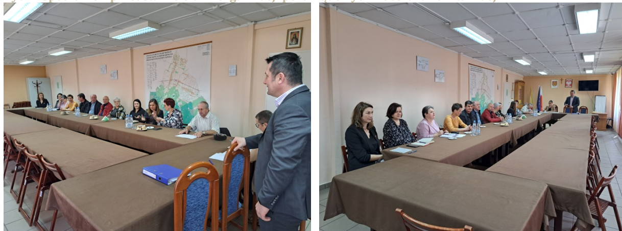
Ryc. 2. Spotkanie z przedstawicielami organizacji pozarządowych z obszaru rewitalizacji